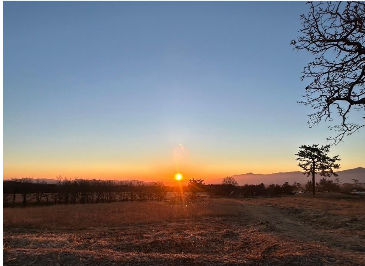
大分県の久住高原からの初日の出