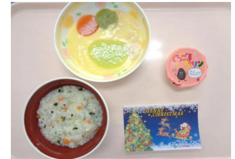
【ペースト食】 雑炊 エッグ&煮込みハンバーグ 黒ゴマプリン