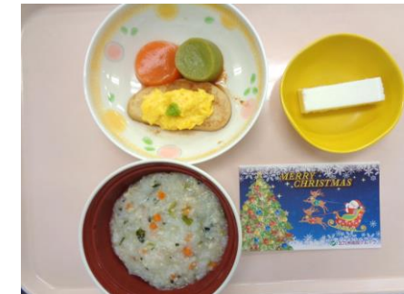
【粥ケア食】 雑炊 エッグ&煮込みハンバーグ クリスマスケーキ