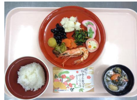
【常食】 雑煮風・菊花かぶ・黒豆 胡麻よごし・ベジタブルフラワー 飾蒲鉾・煮合わせ・栗きんとん