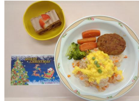
【常食】 オムライス風 煮込みハンバーグ クリスマスケーキ