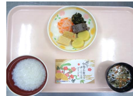
【粥ケア食】 雑煮風・菊花かぶ風・黒豆 胡麻よごし・鮭ソテー カレイのあんかけ煮・栗きんとん