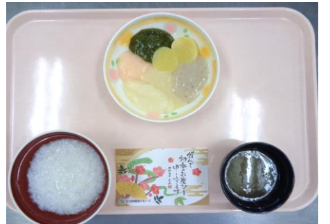
【ペースト食】 雑煮風・菊花かぶ風・黒豆 胡麻よごし・鮭ソテー カレイのあんかけ煮・栗きんとん