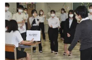
ジェスチャーゲーム