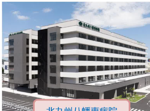
北九州八幡東病院